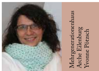
Mehrgenerationenhaus Arche Eilenburg Yvonne Pötzsch