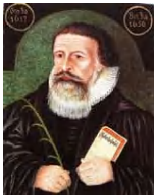
Magister Martin Rinckart (1586-1649)

Am 24. April 2024 gedenken wir des 438. Geburtstages von Martin Rinckart . Der RinckART e.V. stiftet zu diesem Anlass Blumen für Rinckarts Grabplatte in der Chorkirche der Stadtkirche.