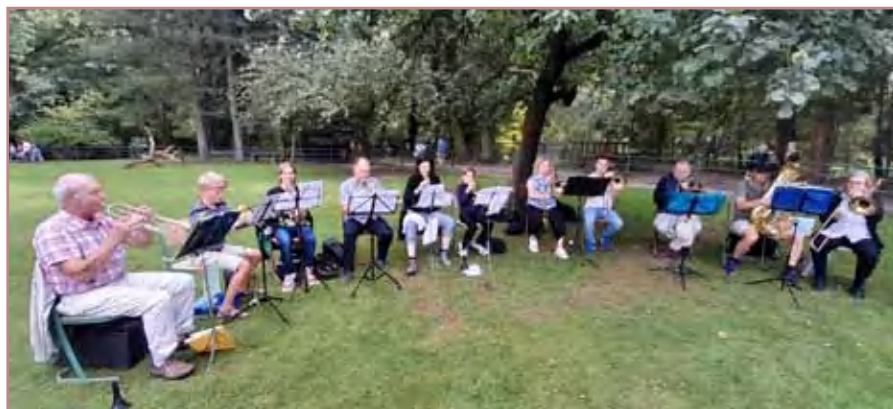
Ein Blick zurück - 3. September 2023: Bläserinsatz beim Tierpark-Gottesdienst.

Konfirmation am Pfingstsonntag mit Posaunenchor Sprotta