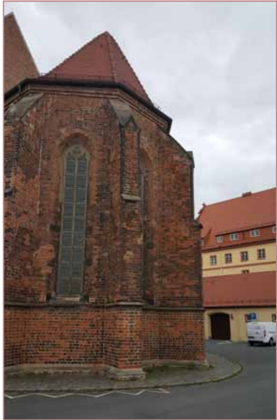
Die Stützpfeiler 6, 8, 9 und 10 werden dieses Jahr saniert.

Wir danken bereits jetzt allen Spendern. Voller Zuversicht schauen wir voraus und hoffen, dass der Kirchenbau weiter unterhalten werden kann und uns Eilenburgern als Begegnungszentrum zur Verfügung steht.