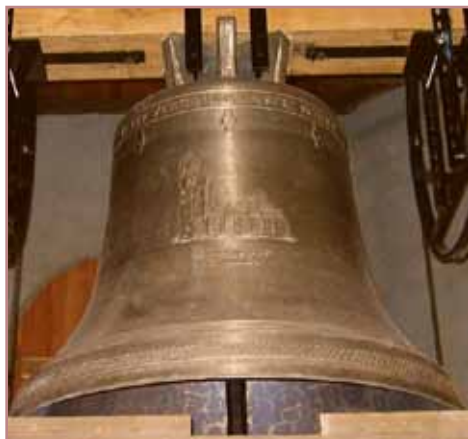
Friedensglocke mit der Silhouette der zerstörten St. Nikolai Kirche von 1945 als Mahnung.