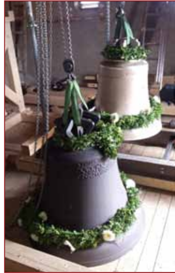
Es ist vollbracht, die zwei Glocken sind sicher im Turm angekommen.